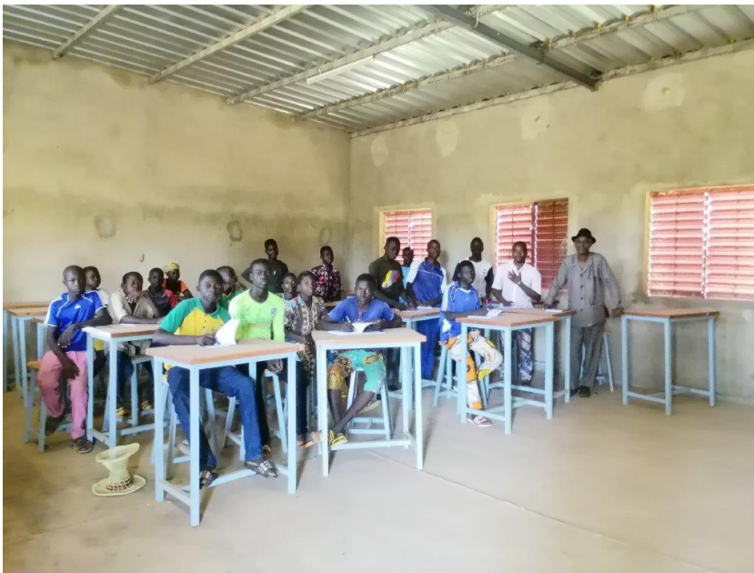
Klasse des Collège de Soaw ; Foto: Christophe.