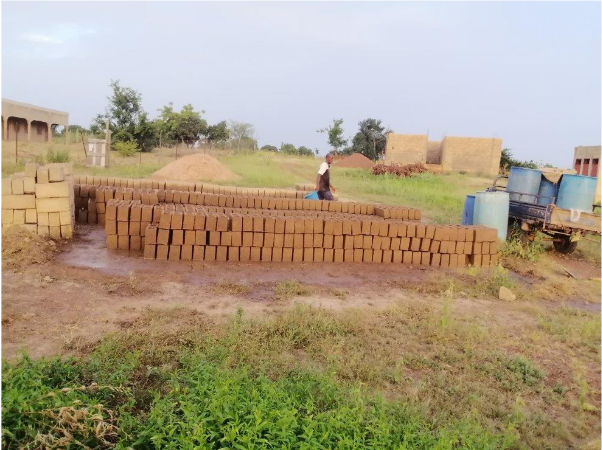
Bauarbeiten für das Collège in Soaw

Im Namen der Menschen aus Soaw bedanke ich mich bei allen, die unsere Projekte begleitet und gefördert haben für ihr Engagement. Ihnen allen wünsche ich eine ereignisreiche und schöne Adventszeit, ein gesegnetes Weihnachtsfest und einen guten Start nach 2023, das hoffentlich ein Licht am Ende der aktuellen "Vielfach-Krisen" aufblinken lässt.