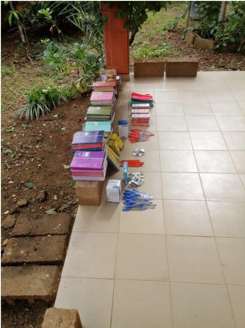
Einige angeschaffte Materialien

Beide Werte belegen die insgesamt gute Arbeit des Lycée de Soaw .