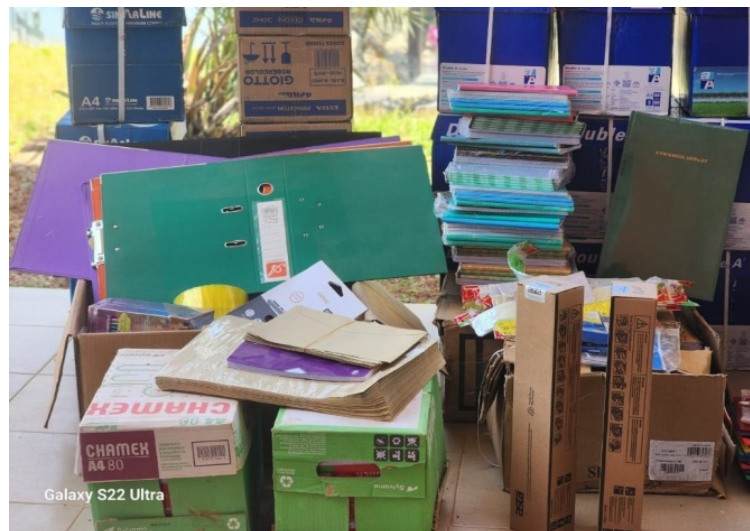
Materialien (Druckerpatronen, Toner, Papier etc.)