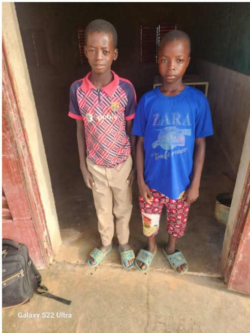
Zwei der durch das Schülerpatensystem geförderte Schüler für das Schuljahr 25/26